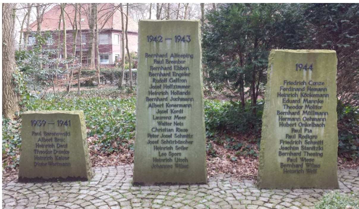
Gedenkstätte Klosterwald Hiltrup Infolge des II. Weltkrieges verstorbene Brüder des Klosters „Herz – Jesu – Missionare“ in Münster-Hiltrup